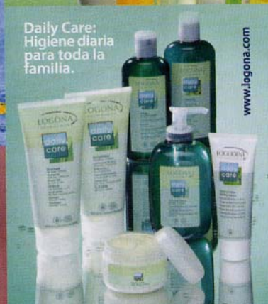
Daily Care: Higiene diaria para toda la familia.